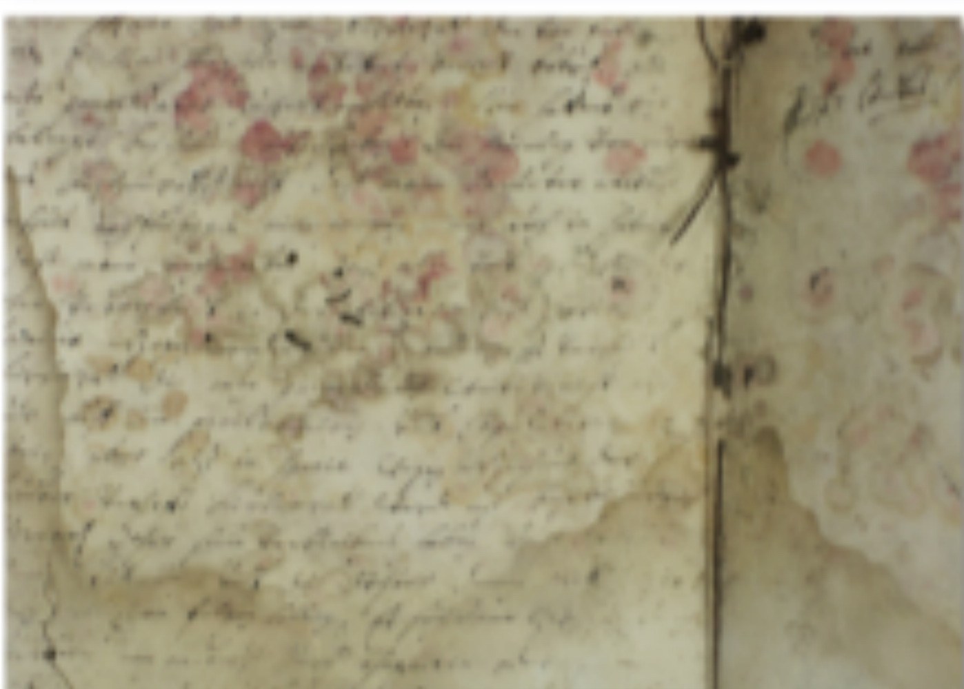
Schimmelbefall an einer Handschrift