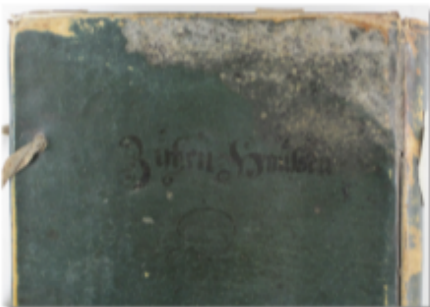
Schimmelbefall an einem Pergamenteinband