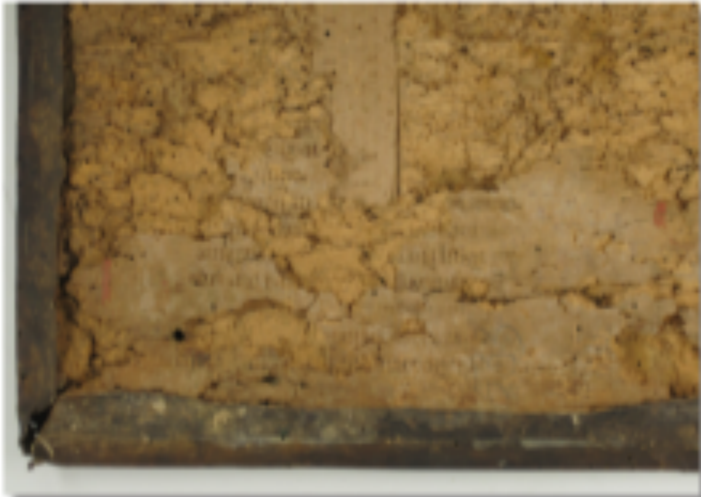
Wurmfraß an einem Holzdeckelband

Beispiele für charakteristische Schadensbilder :