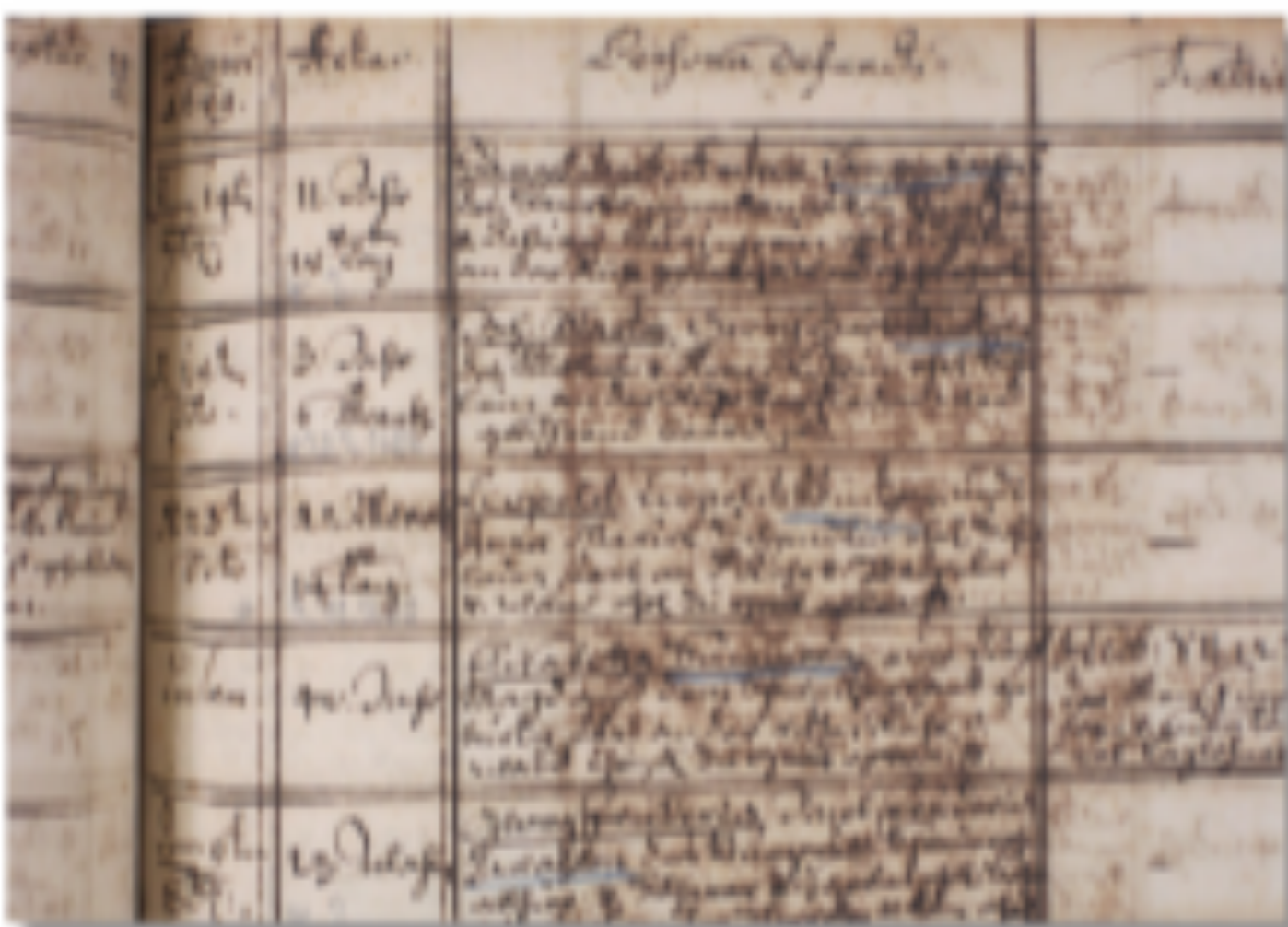
Tintenfraß in einem Kirchenbuch