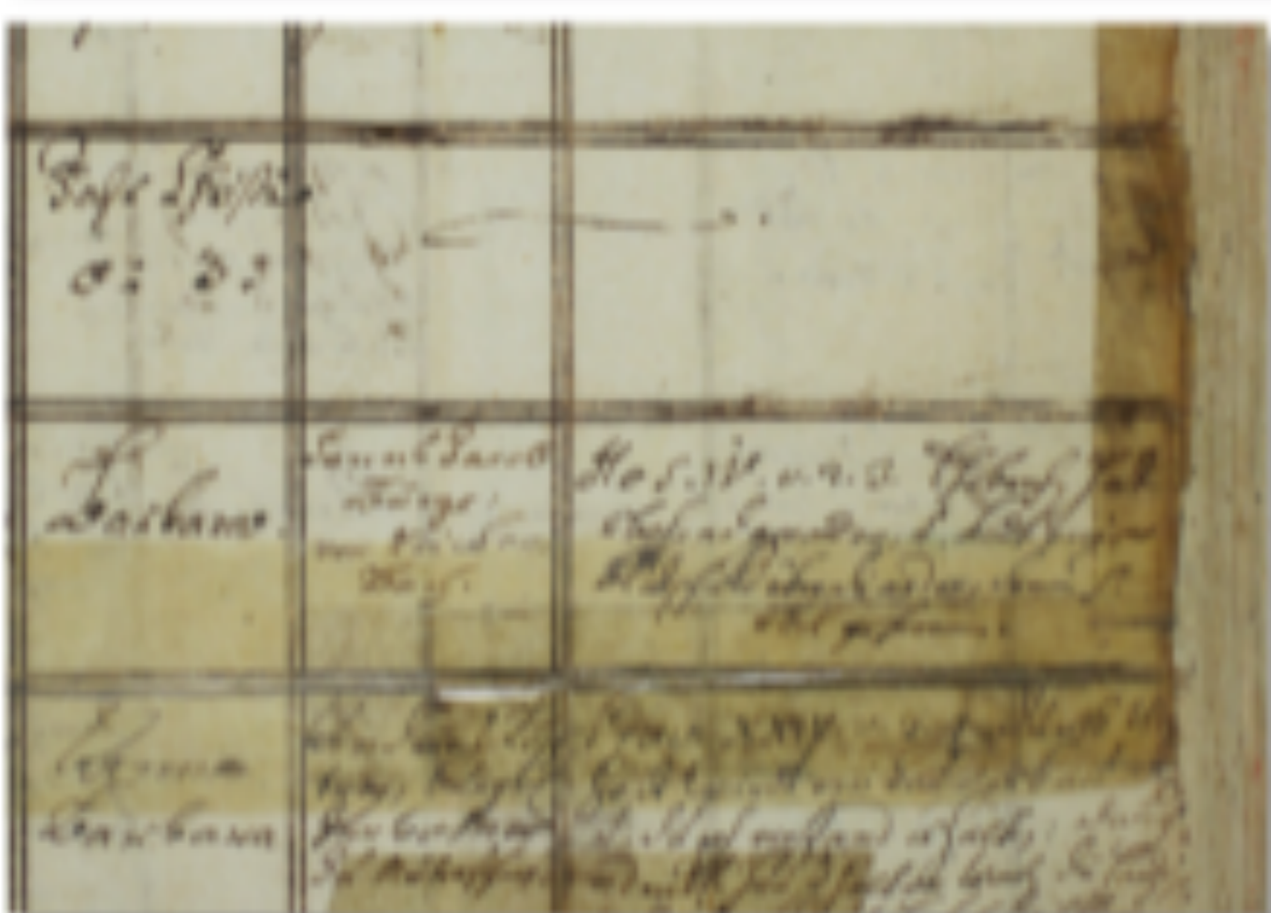
„Reparatur“ mit Selbstklebeband